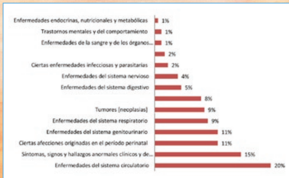
Gráfica 34. Mortalidad por grupos diagnósticos mayores. Compensar, año 2007.